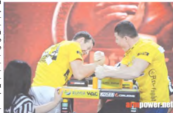
Кафедра физической культуры