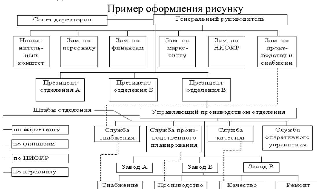
Рис. 1.1 Организационная структура предприятия

Для всех иллюстраций принято единственное обозначение «Рис.» (рисунок) после которого указывают номер рисунка и тематическое название. Каждую иллюстрацию в курсовой работе (за исключением иллюстраций приложений) следует нумеровать арабскими цифрами с порядковой нумерацией в пределах раздела. Номер рисунка состоит из номеров раздела и порядкового номера рисунка, отделенных точкой (Рис. 1.1). Если рисунок один, его помечают «Рис.». Рисунок каждого приложения помечают отдельной нумерацией арабскими цифрами с добавлением перед цифрой обозначения приложения (Рис. Б.2). Номер рисунка и его название размещаются под рисунком. При необходимости под иллюстрацией размещают объяснительные данные. Обозначение «Рис.», номер рисунку и его название размещают после объяснительных данных.